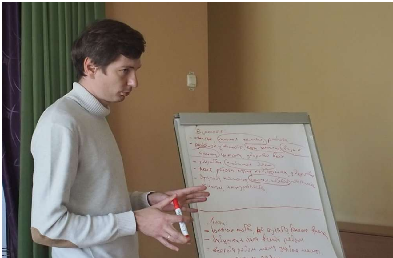
Проведение групповой консультации психолога