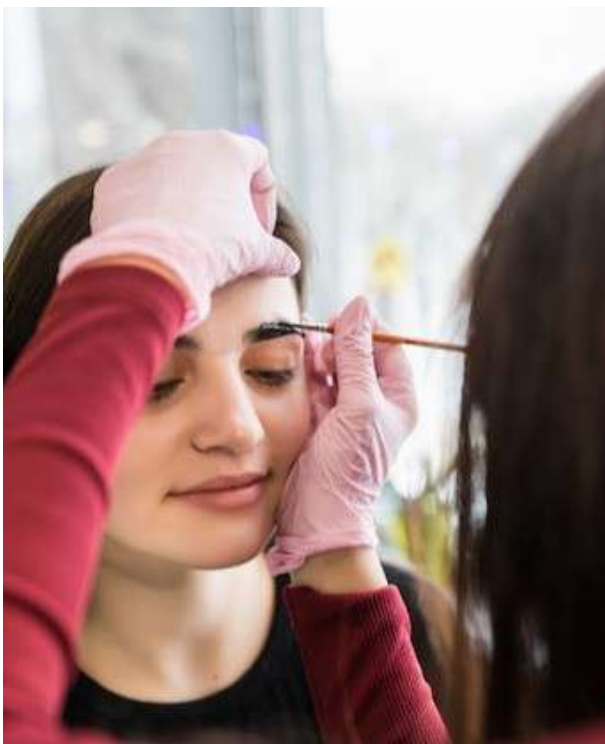
Практическое занятие по окрашиванию бровей